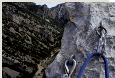
Un mosquetón con seguro