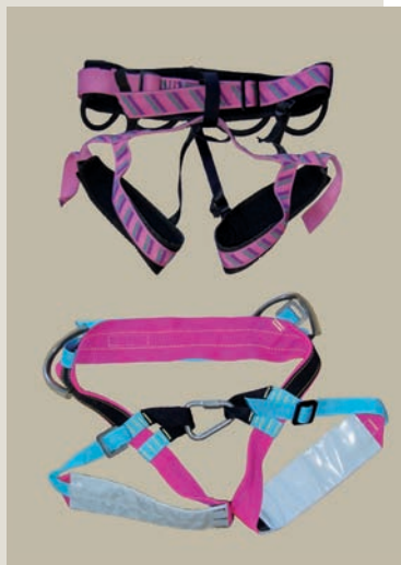
Arnés (con ojal o asegurador de anilla rápida)