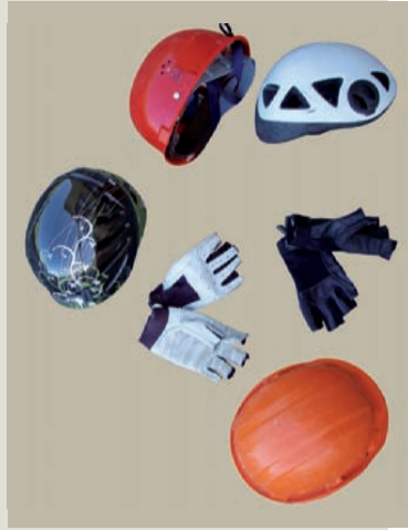
Casco, guantes o mitones