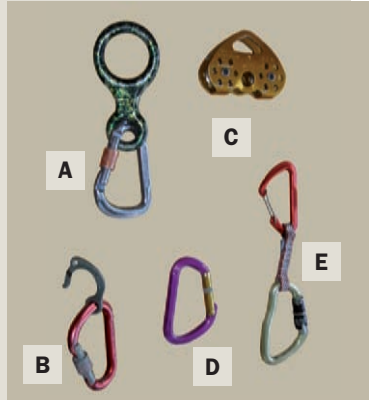
A. Ocho descendedor de mosquetón grande. B. Fifi para descansar. C. Polea para tirolina. D. Mosquetón. E. Cinta exprés con mosquetón de seguridad