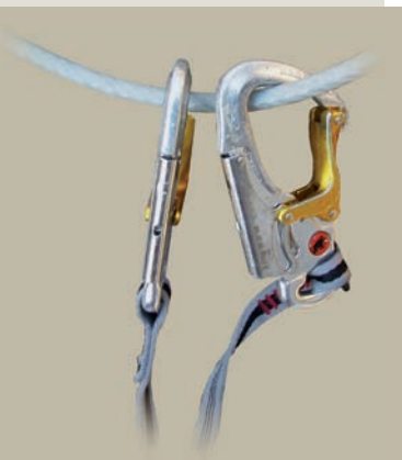
Los mosquetones grandes de cierre automático... o 2 ascendedores de puño