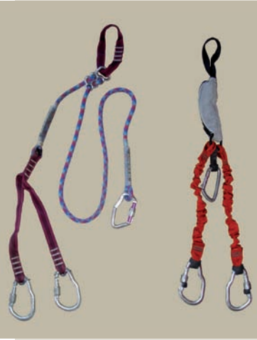
Cinta exprés (o costura) vía ferrata en «Y» con disipador de energía (mecánico o de desgarre)