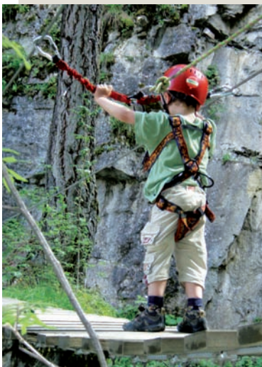
Arnés integral para niños