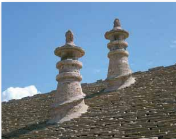
Chimeneas cónicas en Castiello de Jaca