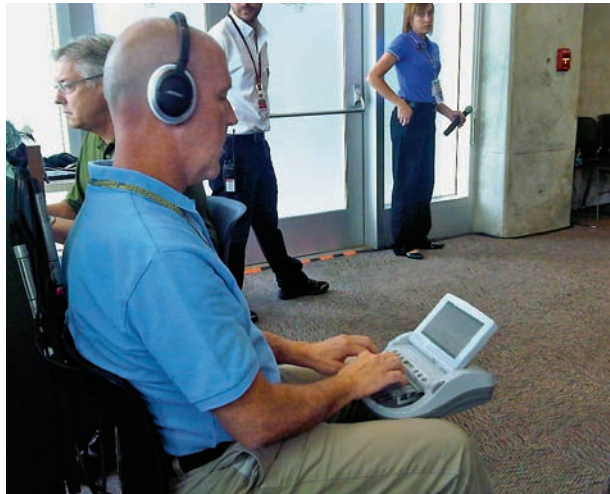
GP de Indianápolis 2013. El único circuito que conozco en el mundo con taquígrafo.